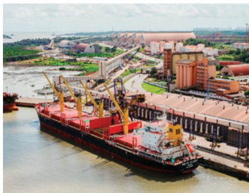
穀物集荷ターミナル

を展開するノバアグリ社の株式を取得し同社を完全子会社とすることで、穀物集荷をはじめとする顧客サービスを強化し、川上から川下にいたるサプライチェーンの確立に取り組み、穀物の安定供給ならびに同分野における更なる事業の拡大を目指してまいります。