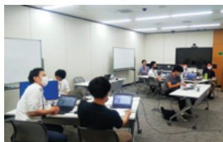
事業化に向けた議論