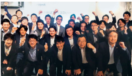
TIVP 推進チームメンバーと参加者

TIVPは、「自分維新! さあ挑戦の 때가きた」をコンセプトに掲げており、社員一人ひとりが志を持って経営を主体的に捉え、社会課題の解決に貢献していくことを大切にしています。このプロジェクトを通じた小さな挑戦・マインドの変化が「強い個」を作り、豊田通商グループの飛躍の一端を担っています。