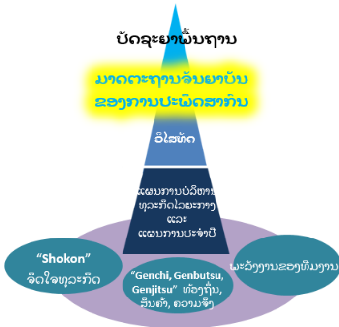
ວິທີການຂອງກຸ່ມ TOYOTA TSUSHO

ໃນຖານະເປັນພົນລະເມືອງທີ່ດີຂອງບໍລິສັດ, ພວກເຮົາຈະມຸ້ງໜັ້ນດຳເນີນກິດຈະກຳຂອງບໍລິສັດແບບເປີດເຜີຍ ແລະ ເປັນທຳ; ພວກເຮົາຈະຮັບຜິດຊອບຕໍ່ສັງຄົມ ແລະ ຮັກສາສິ່ງແວດລ້ອມ; ພວກເຮົາຈະມີຫົວຄິດສ້າງສັນ ແລະ ສູ້ຊົນເພື່ອສ້າງມູນຄ່າເພີ່ມ; ແລະ ພວກເຮົາຈະເຄົາລົບນັບຖືຜູ້ອື່ນ ແລະ ສ້າງສະພາບແວດລ້ອມການເຮັດວຽກແບບມີສ່ວນຮ່ວມ.