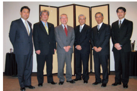
企業価値向上のため相互に協力

今後は、両社の強みを活かし、相互の食料事業の更なる拡大と、新しいビジネスへの展開を目指していきます。