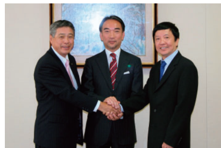
相互のパイプをより強固にしてい

今後は、当社が持つ機能およびネットワークと、福助が持つ実用衣料のノウハウを活かし、実用衣料分野の更なる拡大を目指していきます。