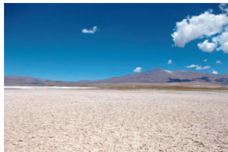
アルゼンチンのプーナ地域に位置する同塩湖

今後は、この事業化調査の結果をもとに、共同出資会社を設立し平成24年より生産を開始する予定です。